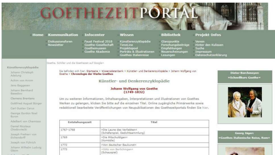
Abbildung 2: Platz 1 (nach Wikipedia) beim Keyword „Goethe Werke“: http://www.goethezeitportal.de/wissen/enzyklopaedie/goethe/goethe-werke.html

Eine Website, die dies eindrucksvoll untermauert, ist das Goethezeit-Portal . Suchen User nach „Goethe Werke“, rankt die Seite auf Platz 1 nach Wikipedia. Die Domain besteht seit 2003, was in der heutigen Zeit recht lang ist. Weder am Content noch an der Form musste seit Erstellung der Tabelle etwas geändert werden. Die Website bietet den relevanten Inhalt in geeigneter Form schon seit mehr als 15 Jahren . Darum sind die Rankings zu dem Keyword besonders gut.